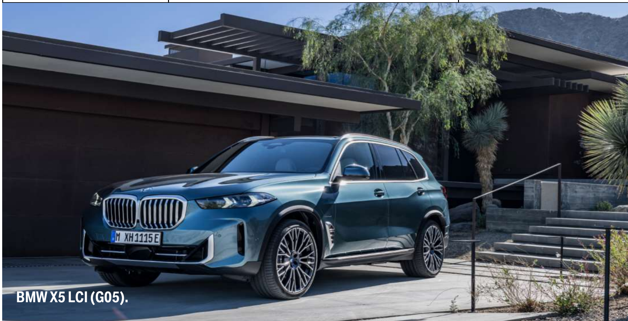
BMW X5 LCI (G05).

Valido a partire da 24.05.2023 per la produzione dal 01.08.2023